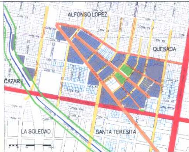
Inmuebles de Interés Cultural - MORFOLOGÍA EN PLANTA