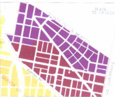
PLANO DE URBANIZACIONES

El el barrio Palermo el trazado a partir de diagonales domina su estructura general. Las vías confluyen a un punto (Escuela Distrital, que hoy no hace parte del barrio), configurando un trazado que hace pensar en varias de las propuestas del urbanista Karl Brunner.